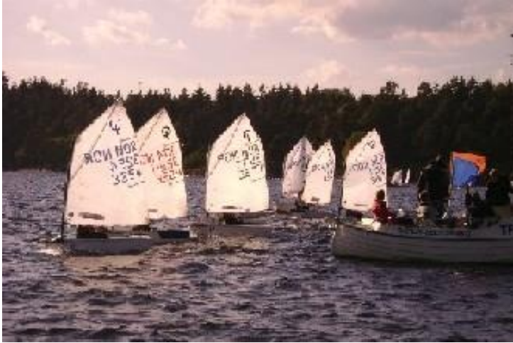
Bilder fra NOKs LagCup i Bærum.

Lageilas er veldig lærerikt og sosialt. NOK LagCup ble en stor suksess og vil bli gjentatt høsten 2010, i tillegg har Tønsberg SF som arrangør av Stor-NM ambisjoner om å arrangere Lag-NM Optimist over 1 dag i forbindelse med Stor-NM.